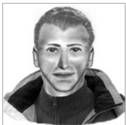
Fahrer des Pkw