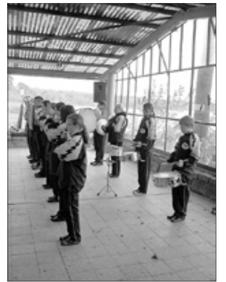
Beim Auftritt in Deutschbase-

Der Spielmannszug Pulsnitz hat in den zwei Wochen Ferien fleißig trainiert: Erst waren wir vom 1. bis 3. Oktober im KiEZ in Sebnitz und übten dort zwei neue Märsche ein, darunter auch die Annemarie-Polka. Diese trainierten wir mit den Spielmannszügen Nossen, Schwedt, Bad Muskau und der Spielegemeinschaft Dahme/Elterwerda. Wir hatten sehr viel Spaß, auch wenn die Übungszeiten lang waren. Nach dem gemeinsamen Übungslager hatten wir unseren alljährlichen Auftritt in Deutschbaselitz zum Fischerfest.