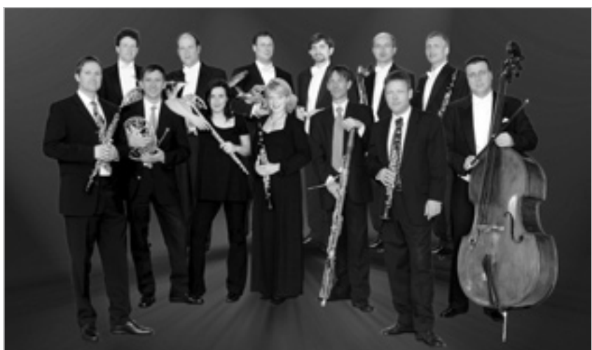
Sie bringen „Hänsel und Gretel“ in Pulsnitz zum Klingen.

Karten für das Konzert sind ab 20. Oktober im Vorverkauf im Ev.-Luth. Pfarramt St. Nicolai, im Schreibwarengeschäft Lindenkreuz in Pulsnitz sowie ab 14:30 Uhr an der Konzertkasse zum Preis von 10 Euro für Erwachsene und 6 Euro für Schüler und Studenten erhältlich. Gruppenrabatte können auf Anfrage eingeräumt werden. Mehr Informationen zum Konzert unter www.mdc-agentur.com/konzert