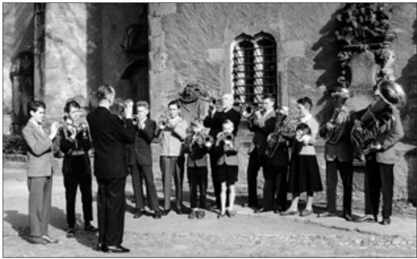
Der Pulsnitzer Posaunenchor in den 60er Jahren

Wenn in den Jahren seit der Gründung über 100 musikinteressierte junge Menschen eine Ausbildung erhielten, so fällt ein großer Teil davon in seine 30jährige Pulsnitzer Zeit.