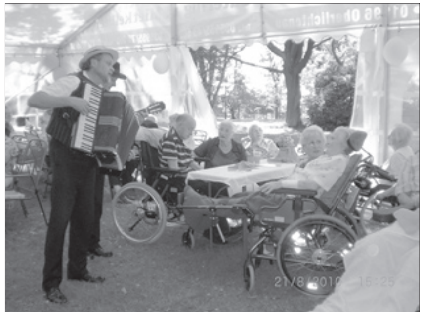
Traditionell gehört zum Sommerfest stimmungsvolle Musik zur Unterhaltung im Zelt des schönen Parkes dazu.

Auch in diesem Jahr fand am 21. August 2010 wieder das traditionelle Sommerfest im wunderschönen Park des Seniorenzentrums statt. Die Bewohner des Hauses kamen mit ihren Angehörigen, um einen erlebnisreichen Nachmittag im liebevoll geschmückten Festzelt zu verbringen. Die „Zwei Vagabunden“ sorgten mit ihrer stimmungsvollen Musik für gute Unterhaltung und es wurde dazu kräftig mitgesungen. Auch Petrus hatte ein Einsehen und bescherzte Sonne pur. Des Weiteren erhielten die Gäste und Besucher in einer Bilderausstellung einen Einblick in das (aktionsreiche) Heimleben im Rittergut. Somit denken alle Beteiligten gern an einen schönen und erlebnisreichen Nachmittag in Ohorn zurück und bedanken sich nochmals bei allen fleißigen Helfern. R. Schneider