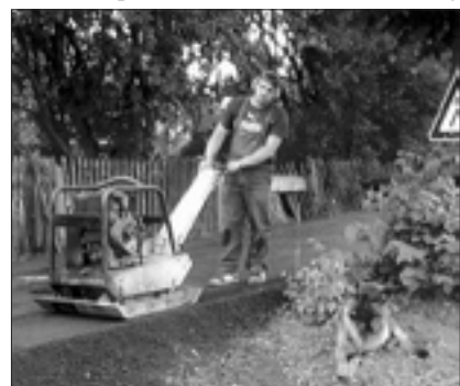
Mit Fachkenntnis gingen die Anliegers ans Werk.

Auf Initiative der betroffenen Anlieger erfolgte in Abstimmung und unter Anleitung durch den Fachdienst Technik der Ausbau der sich vorher in einem sehr schlechten Gesamtzustand befundenen Gemeindestraße Meißner Weg in Friedersdorf. Die Bauleistung erfolgte ausschließlich durch sachkundige Anlieger. Die Finanzierung der Technik und des Materials übernahm die Stadt Pulsnitz. Es erfolgte der Einbau von Querrinnen aus Granitpflaster zur Oberflächenableitung