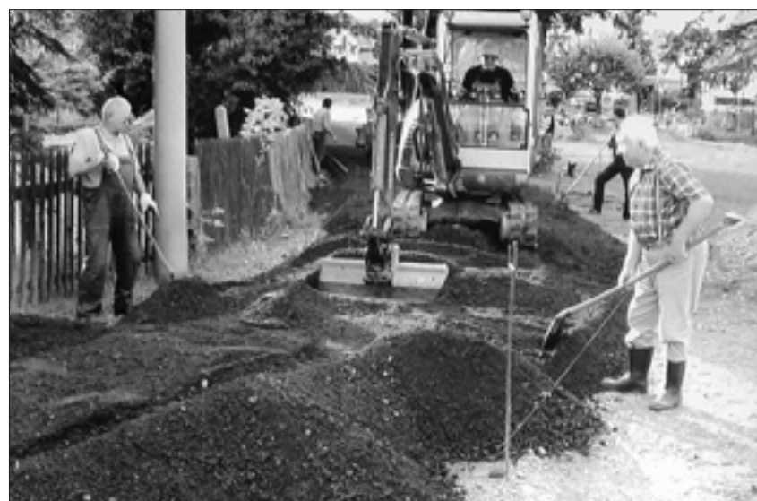
Alle zehn Anwohnerfamilien packten fleißig mit an, als es um den Ausbau des Meißner Weges ging.

Diese werden die Sicherheit der Fußgänger und insbesondere der Fahrzeugführer erhöhen, da die Aufstellung an schwer einsichtbaren Verkehrsflächen vorgenommen wurde. D. S.