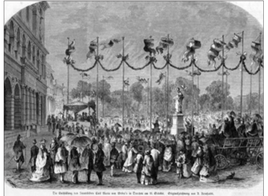
Stich von der Einweihungsfeier des Weber-Denkmal in Dresden vor 150 Jahren

Rietschel hat mit dem Denkmal genial die große Dualität Webers als Kapellmeister und Komponist erfasst. Als Kapellmeister scheint die linke Hand, ein Dirigit anzudeuten, denn nicht nur die großen Hände Webers waren legendär, sondern auch sein Charisma, denn er konnte mit den Augen dirigieren, so dass