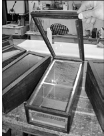
Blick in die Riechboxen

Unter der Überschrift: „An den Riechboxen herrscht Hochbetrieb“ wurden vier durchsichtige Kästen beschrieben, an deren Vorderseiten kreisrunde Riechgitter angebracht waren. In den Kästen lagen