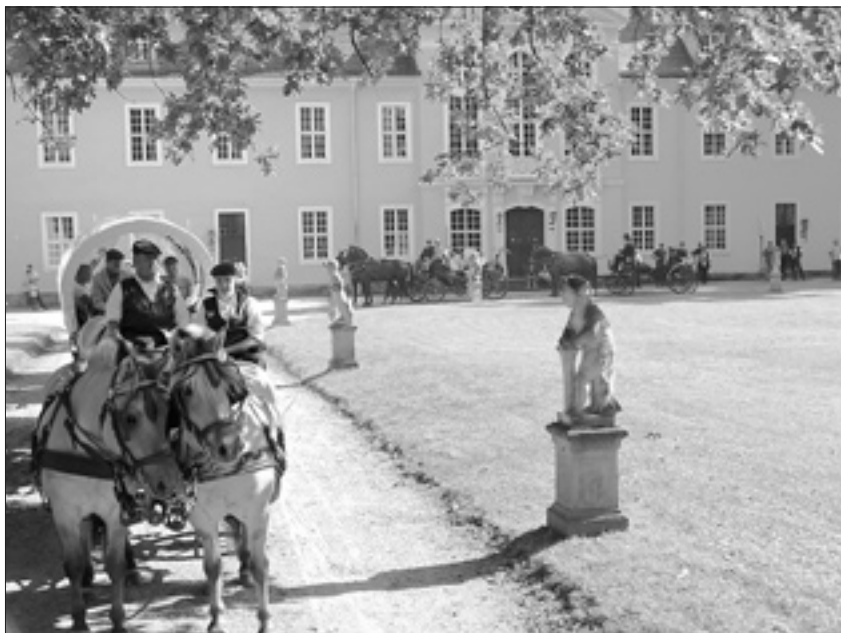
Siegerehrung der Keulenbergrundfahrt im Oberlichtenauer Schloss.