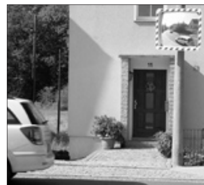
Neuer Verkehrsspiegel in Oberlichtenau

In den letzten Wochen wurden unter anderem im Einmündungsbereich Weißbacher/Pulsnitztalstraße im Ortsteil Oberlichtenau und ganz aktuell im Einmündungsbereich Brückenweg/Vollungstraße in der Pulsnitzer Völlung Verkehrsspiegel aufgestellt.