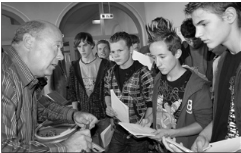
Mit konkreten Fragen interessieren sich die Schüler für die Handwerksberufe.

künftige Fleischer gesucht. „Froh über jede Bewerbung“ sei das Unternehmen, erfahre ich an diesem Stand und sie konnten auch schon erste Begeisterung erwecken. Dicht umlagert war auch der Stand der Jurisch Haustechnik und der Fa. Ulrich Haase Fahrzeugbau/Metallbau aus Kamenz. Hier interessierten sich besonders die Jungs, wie Rohre für die Verlegung vorbereitet werden und welches Werkzeug dazugehört, um Metallbauer oder Anlagentechniker für Sanitär- Heizungs- und Klimatechniker zu werden. Die Firma Fuschs + Girke aus Ottendorf-Okrilla stellte Ihre Branche mit Bau und Denkmalpflege vor. Hier können Klempner, Maler/Lackierer, Metallbauer, Steinmetz, Stuckateur und Zimmerer ausgebildet werden. Insgesamt zeigten sich die Unternehmen sehr angetan von der guten Organisation durch die Schule und das rege Interesse der Schüler. Sie bekamen einen konkreten Erkundungsauftrag mit Fragen zu den einzelnen Firmen und Berufen. Im Unterricht erfolgt dann eine gezielte Auswertung der gesammelten Erfahrungen. In dieser Art, mit Einladung der Firmen in die Schule, sei es das erste Mal, dass die Schule einlädt, in den zurückliegenden Jahren bildeten sie Interessengruppen unter den