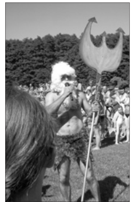
Der größte Dank gilt aber selbstverständlich unseren Gästen!

eine große Leinwand mit WM Übertragung und als besonderes Highlight gab ein Double von Andrea Berg auf der großen Showbühne ihr Bestes.