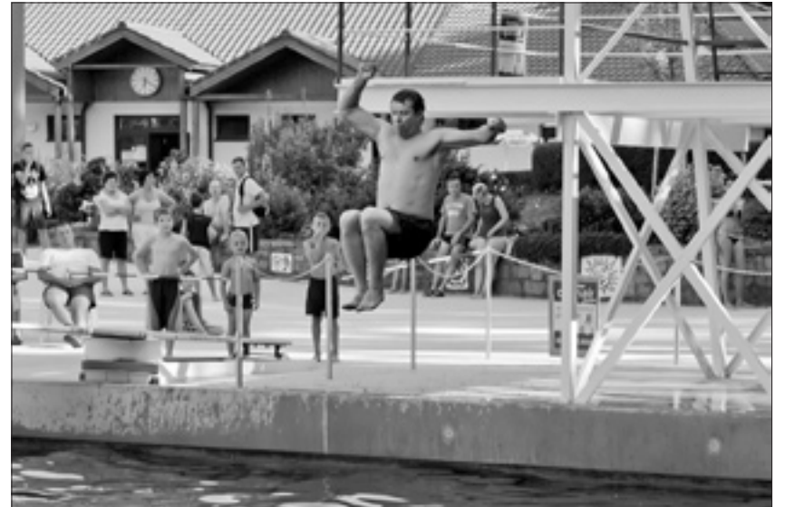
Viel Gaudi gab es bei der 1. Pulsnitzer Arschbombenmeisterschaft.

Den krönenden Abschluss machte dann der Pulsnitzer Spielanzug mit einem Lampionumzug in Richtung Stadt.