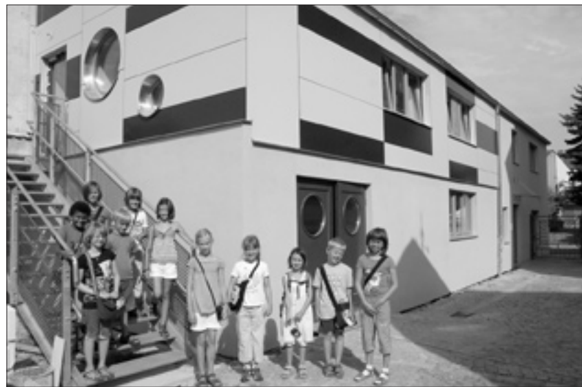
Die Hortkinder vor den neuen Fassade des Anbaus an der Schatzinsel

Um das gesamte Kita-Gelände erfolgt derzeit die restliche Montage des Zauns und die Verlegung der Entwässerungsleitung. Die Freiflächengestaltung im Garten ist