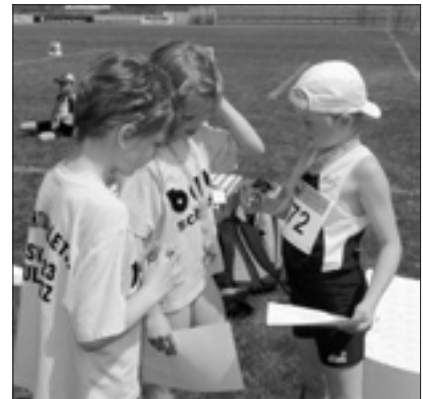
Die Mädchen der Staffel SchiD

Eine besonders starke Mannschaftsleistung zeigten alle vier angetretenen Sprintstaffeln, die jeweils mit deutlichem Vorsprung siegen.