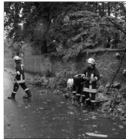
Sturmschäden an der Fabrikstraße beseitigte die FFW nach einem Gewitter.

Zum Glück zog die Gewitterfront in den Vormittagsstunden des 17. Juli ohne große Schäden zu hinterlassen über Pulsnitz hinweg. Trotzdem musste 8.27 Uhr Ge-