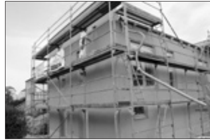
Letzte Pinselstriche an der Fassade des Anbaus am Spatzennest

Beim Anbau sind bis auf die derzeit laufende Elektroendmontage alle Arbeiten abgeschlossen, sogar Maler und Fußbodenleger konnten die Baustelle nach getaner Arbeit bereits verlassen. Erste Möbel stehen bereits in den Zimmern und warten auf den Aufbau und die endgültige Raumgestaltung. In der vorletzten Juliwoche legten die Maler an der Fassade noch einmal die Pinsel an und glichen den Anbau in Farbe und Gestaltung dem bisherigen Gebäude an.