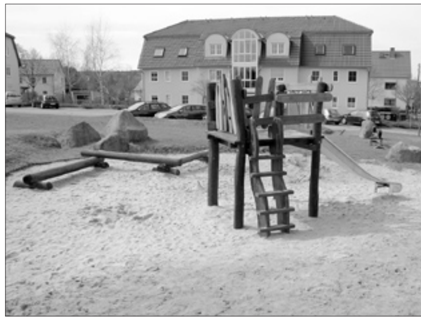
Der Spielplatz am Böhmisches Eck bekam schon im letzten Jahr eine neue Rutsche – doch es ließe sich noch mehr aus dem Gelände machen.