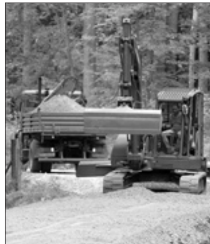
Der Forstweg ist nun freigegeben.

Die geplanten 700 m Wegebau im Stadtwald am Schwedenstein wurden von der Burkauer Firma Neumeister in sehr guter Qualität fertiggestellt und in der vorigen Woche abgenommen. Die vorgegebenen Parameter von drei Metern Fahrbahnbreite und je 50 cm Bankett an den Wegerändern sowie der Schichtenaufbau des sandgeschlämmten Schotterweges wurden projektgemäß ausgeführt.