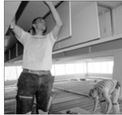
Der Trockenbaufachbetrieb Eberhardt aus Pulsnitz hat an der 300 m 2 großen Fläche der Akustik-Unterhangdecke in luftiger Höhe auf dem Innengerüst vier Wochen zu tun.

Ende Juli beginnt die Werkplanung für den Innenausbau des Saales. Für Anfang August steht der Einbau der Fenster und Türen für den Saal im Plan.