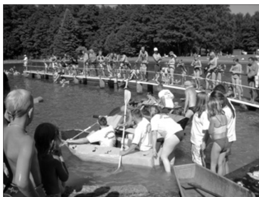
Der Spielmannszug (vorn im Bild) gewann die freie Staffel beim Badewannenrennen.