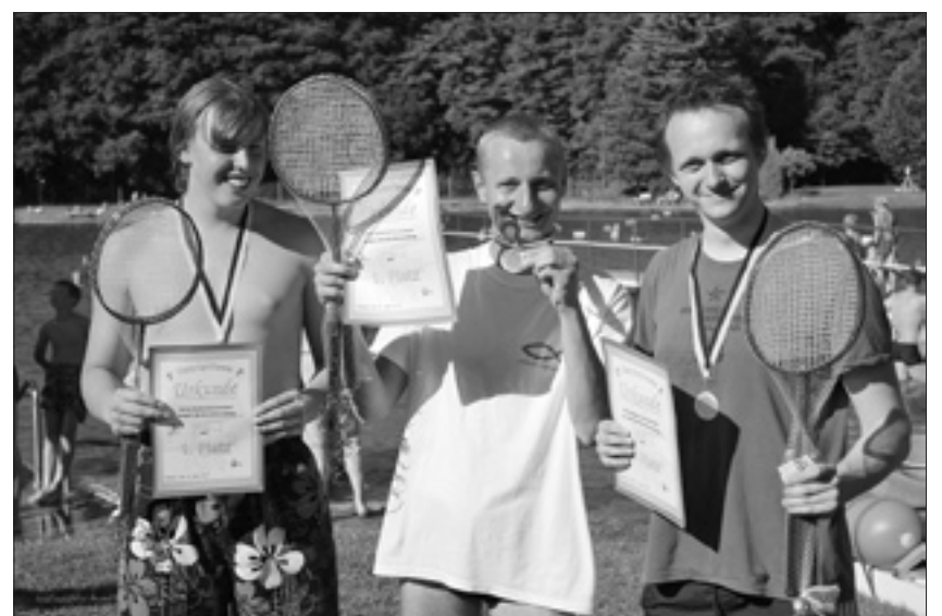
Die Sieger des Badewannenrennens