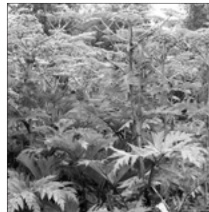
Über 2 m hoher Riesenbärenklau

In der letzten Ausgabe des Pulsnitzer Anzeigers wiesen wir auf Seite 7 auf die nicht heimischen Pflanzen, die sogenannten Neophyten, hin, die auch in Pulsnitz und seinen Ortsteilen sich immer weiter ausbreiten und die natürlichen Pflanzen verdrängen. Besonders großflächig breitete sich der Riesenbärenklau an beiden Ufern der Pulsnitz auf einer Lichtung und im Randbereich der ehemaligen Deponie an der Königsbrücker Straße aus. Die über zwei Meter hohen Pflanzen bilden imposante Fächerblätter und Blütendolden aus. Sie sind nicht unbedenklich zu entfernen, da sie giftige Substanzen enthalten, die bei Berührungen zu schweren Verbrennungen führen können. Schutzkleidung ist unbedingt erforderlich. Die Pflanzen sind mit dem Wurzelstock zu entfernen und in einer Plastiktüte verpackt über den Restmüll zu entsorgen. Der ausgefallene Samen ist noch nach vielen Jahren keimfähig. Die Flächen müssen daher mehrfach und möglichst zu Beginn der Vegetationsperiode noch vor der Blüte für eine dauerhafte Verbannung der Pflanzen bereinigt werden.