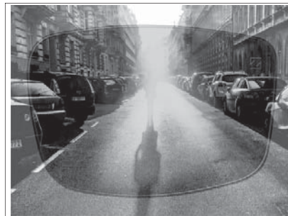
Mit herkömmlicher Sonnenbrille

Mo – Fr.: 10 – 13 14 – 18 Uhr Samstag: 9 – 12