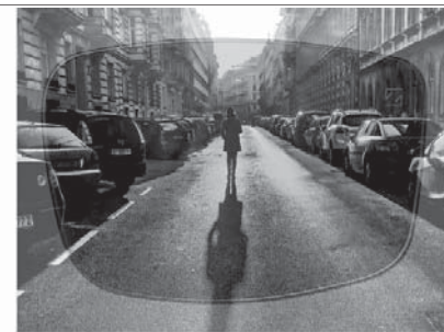
Mit ZEISS SkyPol®

Der Brillenwechsel beim Betreten von Räumen oder schattigen Bereichen entfällt.