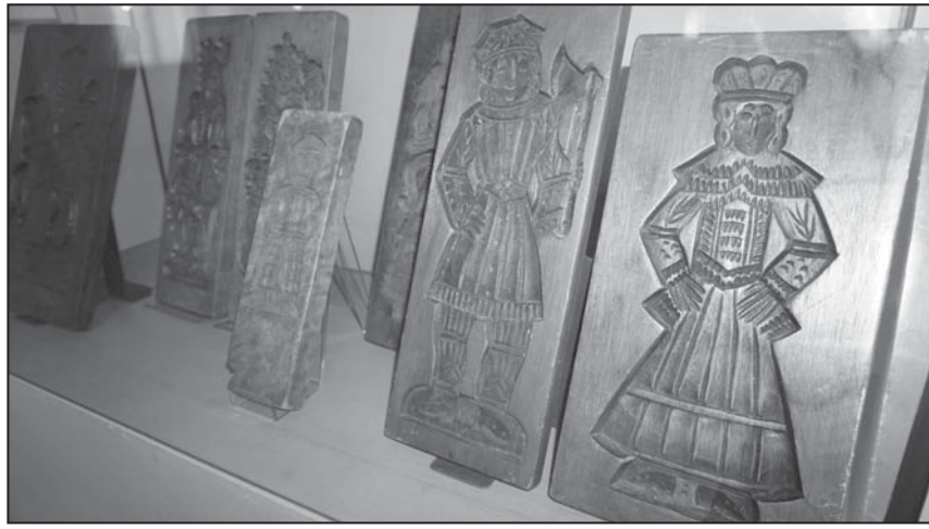
Auszug aus der Ausstellung

lung Manfred Liere aus München, welche bisher in Kisten lagerten und noch in keine Ausstellung ihren Weg fanden. Ergänzt werden diese mit Bild- und Schriftmaterial sowie weiteren Utensilien für die Gestaltung von Pfefferkuchen. Modelle dienten damals nicht nur der Gestaltung, sondern erzählten auch Geschichten oder waren beispielsweise Grundlage für Kin-