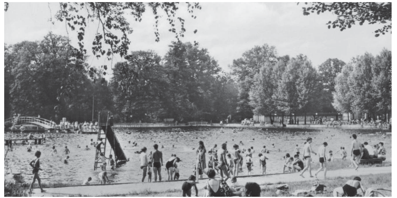
Hochbetrieb im Walkmühlenteich ca. 1963 / 64

Entgegen den Behauptungen von Pulsnitzer „ewig Besserwissenden“ war eine Schließung der „Walke“ im Stadtrat nie ein Thema! Das ehemalige Volksbad an der Mittelbacher Straße war mit der Wiedereröffnung des Walkmühlenteiches dem Verfall preisgegeben.