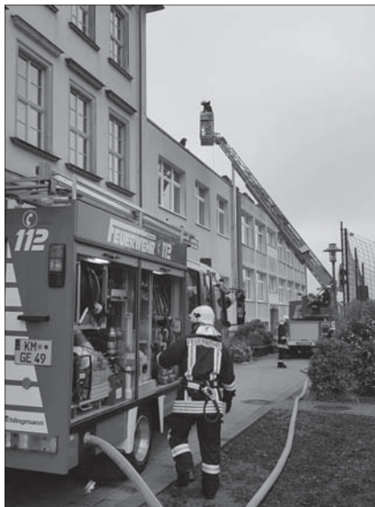
Training der Evakuierung der Grundschule

TLF und HLF, sowie die Feuerwehr Pulsnitz mit der Drehleiter vor Ort. Es wurde ein vermutlicher Brand im Keller-