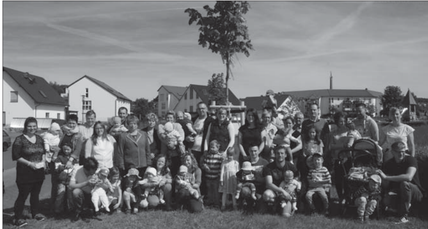
Am 26. Mai 2019 fand der Empfang für die neun Mädchen und acht Jungen, die 2018 geboren wurden mit der Einweihung der Kindertafel statt. Den Kinderbaum, ein Spitzahorn, spendete Familie Schinzel.