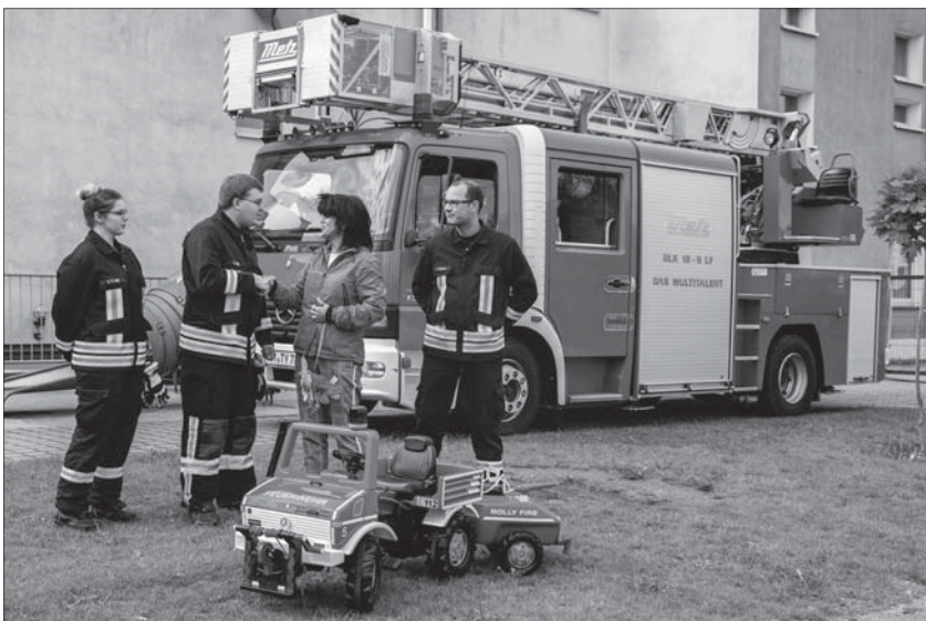
Die Kita Kunterbunt erhielt vom Feuerwehrverband ein Spielzeugauto für ihre Hilfe bei den Dreharbeiten – natürlich einen Feuerwehr!

Hintergrund für die Spende ist die Zusammenarbeit zwischen dem Kreisfeuerwehrverband (KFV) Bautzen, der Ortsfeuerwehr Pulsnitz und der Kita Spatzennest bei zwei Videoprojekten. In den Jahren 2017 und 2018 wurden zwei erfolgreiche Filme zum Thema Rettungsgasse und Rauchmelder produziert, in denen die Vorschulkinder der Kita Haupt-