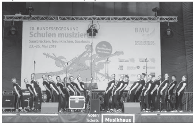
Der Pulsnitzer Popchor beim Auftritt im Theater am Ring

Vielzahl macht deutlich, dass es keinen klassischen Vergleich als Wettbewerb um die beste Schülermusik geben konnte, sondern die jungen Musiker einander