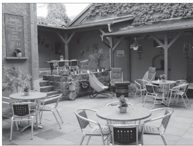
Im Innenhof lädt ein gemütlicher Biergarten ein.

alle Generationen zu Gast. Schöne lockere Stunden können Jung und Alt hier gemeinsam verbringen wie beispielsweise am Kindertag oder zu Halloween mit Hüpfburg, Kinderschminken etc. Als besonderer Renner hat sich das Eisangebot etabliert. Seit zwölf Jahren bietet er Kugel- und eigenes Softeis an. Mit zwei Eismaschinen produziert er aus natürlichen Inhaltsstoffen seine 15 wechselnden Sorten. Neben den Klassikern Vanille-Schokolade entstanden unzählige kreative Eissorten wie das zum Haus passende Pfefferkucheneis, Johannisbeer-Schokolade,