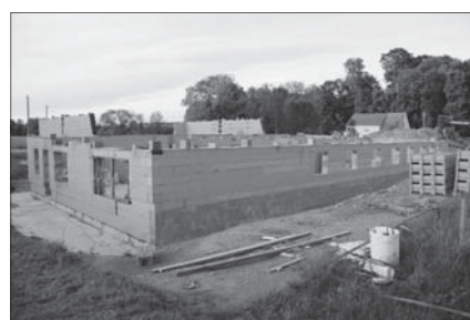
Rohbau vom Feuerwehrgebäude

Auf der Baustelle zum Feuerwehrgerätehaus in Oberlichtenau wächst der Rohbau. Bisher gab es eine Woche