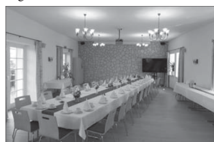
Blick auf eine gedeckte Tafel

fentlichen Nutzung für private Veranstaltungen und Feiern oder für Firmen zur