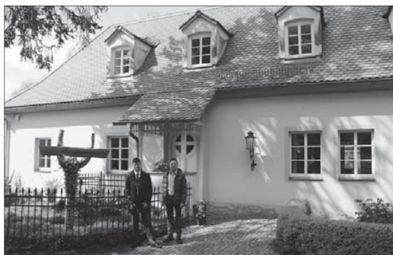
Klinikchef Carsten Tietze und Hotelserviceleiter Maik Nicolaus vorm Gartenhaus

Verfügung. Künftig sind auch Trauungen hier möglich, sowohl die offizielle Trauhandlung wie auch die anschließende Feier. Der große Saal bietet für 40 Personen bequem Platz, der kleine gemütliche Raum im Dachgeschoss bietet zusätzlich bis 20 Plätze. Die überdachte und beleuchtete Terrasse mit Blick auf den Schlossteich steht ebenfalls mit zur Verfügung und ist im modernen Look mit 34 Plätzen ausgestattet. Zwei Ruderboote am eigenen Anlegesteg warten auf Zustieg zur lustigen Kahnpartie. Am 21. Juni können sich die Besucher von der Location überzeugen und auch einen Blick in die dazugehörige kleine Küche werfen. Bei Interesse für eine Buchung können Sie sich an Maik Nicolaus wenden: Tel. 03 59 55/5 29 03 oder per Mail an maik.nicolaus@vamed-gesundheit.de , er unterbreitet Ihnen gern ein Angebot. Die Klinik nutzt diesen Tag aber auch zur eigenen Vorstellung und zur Personalwerbung. Die Helios Kliniken Schloss Pulsnitz und Schwedenstein wechseln