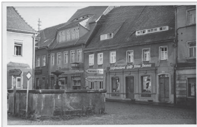
Historische Ansicht der ältesten Pulsnitzer Pfefferkühlerei