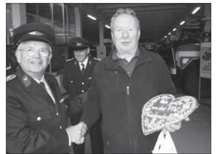
Im Zeithainer Museum

in beiden Museen übergaben wir als kleines Dankeschön u.a. je ein Mitbringsel aus Pulsnitz – ein Pfefferkuchenherz mit Grüßen aus beiden Ortsteilen.