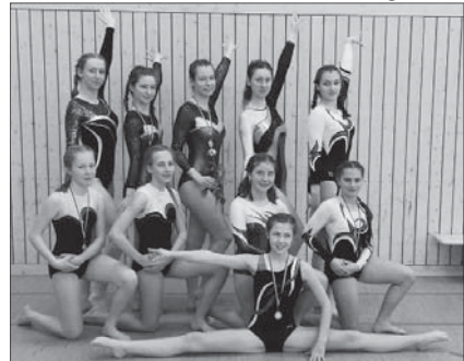
Die Turnerinnen (Jugend/Erwachsene) der SGO

An den letzten zwei Märzsonntagen fanden die Kreismeisterschaften im weiblichen Bereich des Turnkreises Bautzen statt. Dabei traten Turnerinnen aus den Turnvereinen Straßgräbchen, Radeberg, Brettnig-Hauswalde, Bautzen, Kamenz, Hoyerswerda und Oberlichtenau an. Sogar Turnerinnen aus Wehrsdorf waren erstmalig dabei, wo Turnen als Ganztagsangebot in der Schule angeboten wird. Eine bunte Truppe kämpfte also um den Titel der Kreismeisterin. Es wurden in allen Alters- und Leistungsklas-