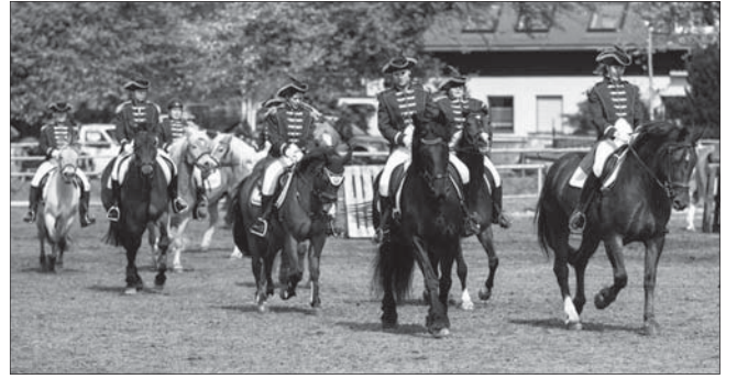
Die neuen Vereins-Uniformen präsentiert in der Quadrille

Die Versorgungsmannschaft wurde durch einen Verkaufsstand mit heißem Met ergänzt, der bei den doch sehr fri-