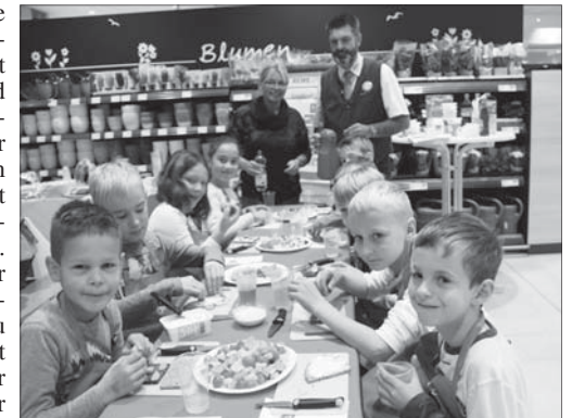
Gesunde Ernährung kann man lernen und es schmeckt den Kindern.

Als erstes belegten sich die Kinder ein gesundes Frühstücksbrot. Doch zuvor ging es um Hygiene, alle Kinder bekamen eine Schürze um, und mussten sich die Hände reinigen. Dann ging es los, das bereits gewaschene und vorgeschnittene bunte Gemüse wie Paprika, Gurke, Kohlrabi und Möhren musste von den Schülern noch ganz klein geschnitten werden. Dann wählten sie sich nach eigenem Geschmack Knäckebrötchen oder verschiedenes Vollkornbrot aus. Das Angebotsortiment von REWE führt natürlich auch Brotsorten, die die zwei Kinder mit Laktoseintoleranz und Glutenunverträglichkeit bedenkenlos