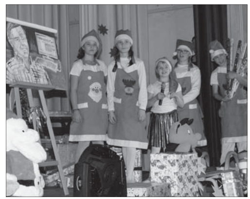
Die fleißigen Helfer des Weihnachtsmanns.

Das Jahr geht seinem Ende entgegen. Doch bevor es sich ganz verabschiedet steht noch Weihnachten ins Haus. Wie bei vielen daheim, finden auch in unserer Schule zahlreiche Vorbereitungen auf das Fest statt. Besonders intensiv sind diese beim Popchor und der Theatergruppe. Der Chor nutzt das Ende November stattfindende Chorlager in Bautzen zur Vorbereitung auf die Auftritte in der Adventszeit und das jährlich stattfindende Weihnachtskonzert der Schule, die Theatergruppe probt wöchentlich in der Schule. Die Aufführungen für die Pulsnitzer Grund- und Oberschüler finden am letzten Schultag vor den Ferien in zwei Veranstaltungen im Schützenhaus statt. Für den Vorabend, Donnerstag, den