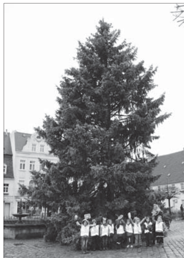
Die Kinder freuen sich über ihren Baum aus der Kita Kunterbunt.

Die Kinder kannten sich aus und wissen, wenn alle Bäume gefällt werden, fehlt auch den Menschen die Luft zum Atmen und dass Bäume die Luft reinigen. Deshalb fand auch der Wunsch von Bruno und den anderen Kindern Gehör bei den Erzieherinnen für Ersatz zu sorgen. Bereits am Donnerstag wurden Eichen gesteckt. Sie stehen jetzt in einem Blumentopf im Gruppenraum auf dem Fensterbrett und werden täglich fleißig gegossen. Genug Licht bekommen sie jetzt durch die Baumlichter auch. So können die Kinder gleich beobachten wie der junge Keimling sich aus der Erde schiebt und wenn er groß genug ist, kann er im großen Kita-Garten einen würdigen Platz bekommen. Diesem Baum können dann auch wieder viele Kinder mehrere Generationen beim Wachsen zusehen. Zum Schluss bekam die Fichte eine dicke goldene Schleife um den Stamm gebunden und die Kinder umarmten ihn noch einmal ganz innig. Viele Kinderarme waren dazu nötig! Zum Abschied winkten sie ihm noch einmal zu und versprochen