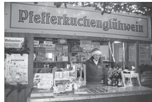
Pfefferkuchenglühwein gibt es bei der Druckerei Schirrmeister

und kalte Getränke sowie ein kleiner Imbiss. Die Druckerei Schirrmeister bringt aus ihrem Sortiment so manche Geschenkidee für Groß und Klein mit. Auch Bestellungen für individuelle Fotodrucke als Weihnachtsgeschenke können hier abgegeben werden. Pulsnitz-Souvenirs