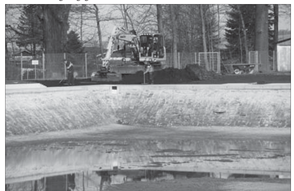
Im Bad ist der letzte Abschnitt der Umrandung des Beckens fertig gestellt. Das Wasser läuft bereits für die nahende Saison wieder ein.

munen hängen bleiben, denn für die Eigenmittel, die wegen dieser Teuerung entstehen, gibt es kein Förderprogramm. Erste Kostensteigerungen von 200-300 Prozent werden berichtet, unsere höchste lag bisher bei 179 Prozent.