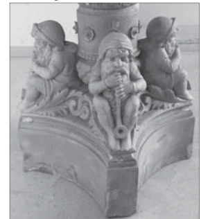
Figuren am Fuß des restaurierten Brunnenaufsatzes