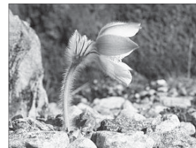
Vom Aussterben bedroht Frühlingskuhschelle (Pulsatilla vernalis)

und ursprünglich 40 Meter im Durchmesser messende Kuppe aus Lausitzer Zweiglimmergranodiorit). Hier am Südosthang wuchs die Pflanze bis etwa 1900 in ziemlicher Häufigkeit und zog viele