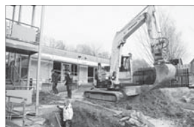
In Oberlichtenau entsteht der Anbau für Krippenkinder.

Das sieht in Oberlichtenau ganz anders aus. Der lange und schneereiche Winter hat ganz schön Verzögerung in das Projekt gebracht, das nun aber auch wieder angeht. Bereits weitgehend unbemerkelt vollendet ist die energetische Sanierung der Heizungsanlage, die uns langfristige Ersparnisse bei den Energiekosten bringen und damit den Haushalt entlasten wird. Der Krippenbau ist im Rohbau fertig, die einzelnen Ge-