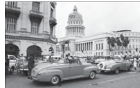
Pulsierendes Leben in Havanna

Prächtige Kolonialstädte, traumhafte Strände und viel Revolutions-Romantik: Kuba ist ein Paradies für Touristen. Für die meisten Einwohner ist das Leben auf der „Zuckerinsel“ jedoch alles andere als süß.