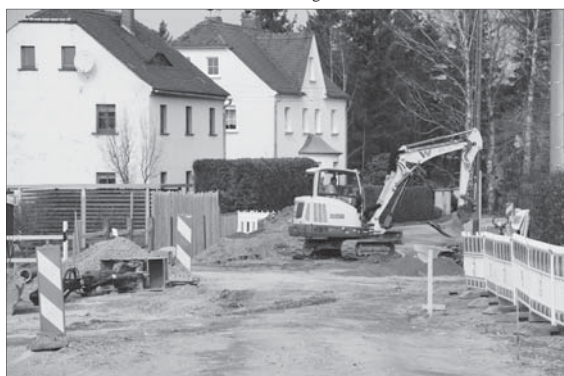
Königsbrücker Straße in Friedersdorf: hier im Bild werden die alten Abwasserrohre entfernt, die neue Leitung ist bereits verlegt.

verteilen sondern wählen dazu verschiedene Wege, dies zweckgebunden zu tun. Einer davon ist die Städtebauförderung, weshalb sie in einem Bundesgesetz geregelt ist und damit allen Bundesländern zur Verfügung steht. Diese können dann jeweils in ihrem Bereich Richtlinien erlassen, wofür genau und wie es eingesetzt werden soll. Das sieht demzufolge in Bayern anders aus als bei uns in