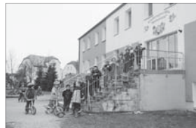
Bald können die Kinder die Treppe wieder gefahrlos nutzen.

Wir bleiben beim Wasser – diesmal dem erfrischenden an heißen Sommertagen oder ganz sportlich auch bei frischen Temperaturen. Nach der Winterpause wird derzeit wieder kräftig am vierten und damit letzten Bauabschnitt gearbeitet, so dass zur Saisonöffnung alles fertig sein wird und dem ungetrübten Badespaß nichts entgegensteht.