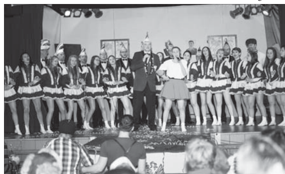
Auftrittsszene aus dem Bühnenprogramm

Doch vorher hat der OLIKA wieder einmal ordentlich gefeiert. Angefangen bei den auswärtigen Veranstaltungen, wie der 25. Prunksitzung in Bischofswerda oder beim 60-jährigen Jubiläum in Lichtenberg. Auch sonst wurde nahezu keine Veranstaltung in der Umgebung ausgelassen. Der endgültige Saisonabschluss fand - wie seit vielen Jahren - in Fischbach bei der Pappnasennachlese am 18. März statt. Auf dem heimischen Saal hatte man ebenfalls wieder jede Menge Spaß. Zur Auftaktveranstaltung heizten die Mädels der Funkgarde des OLIKA dem Publikum pünktlich um 21:11 Uhr mit ihrem Funkentanz richtig ein. Der Kinderfasching, diesmal wieder mit unseren Clowns „Pampeluse“ und „Peppo“, war ein gelungener Spiel-, Spaß- und Tanznacht. Die tollen Tanzleinlagen der „Minimäuse“ (1./2. Klasse), der „Maximäuse“ (3./4. Klasse) und der „OLKätzchen“ (5.-9. Klasse) taten ihr übriges und wurden lautstark bejubelt. Am Faschingswochenende meinte es Petrus wieder sehr gut mit allen Karnevalisten. Samstag ging es, wie jedes Jahr, nach Königsbrück zum Umzug. Abends dann wieder unser traditioneller Frauenfasching auf einem sehr gut gefüllten Saal mit spontanen Tanzleinlagen „der sieben Stünden“ weit nach