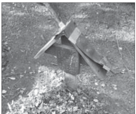
Trostloser Anblick der Holzkreuze

Am 13. April, einem Montagmorgen, entdeckten die Friedhofsmitarbeiter einen besonderen Fall von dreistem Kupfer-Diebstahl und informierten umgehend die Polizei. Von allen 53 Kriegsgräbern waren die Kupferauflagen der Holzabdeckungen der Kreuze gestohlen worden. Die Kupferbleche wurden von ihren Befestigungen heruntergerissen, sie stehen oder hängen nun schief und verbogen an den demolierten Holzkreuzen. Die Diebe verursachten einen erheblichen Schaden an den Dächern zusätzlich zum eigentlichen Kupferklau. Der Sachschaden wird inzwischen mit 7.000 Euro beziffert, der moralische Schaden ist unbeschreiblich, für den sich eigentlich keine Worte finden lassen. Bei solch respektlosem Verhalten sind Friedhofs- und Stadtverwaltung einfach nur entsetzt. Auch Besucher des Friedhofes sind entrüstet angesichts dieser Zerstörungswut. Bislang führten die Ermittlungen der Polizei jedoch noch zu keiner heißen Spur.