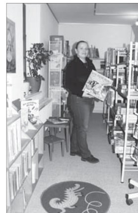
Die Bibliothek ist neu gestaltet

Unter www.pulsnitz.bbcom.de Interessierte jederzeit auf den Bibliotheksbestand von Pulsnitz zugreifen. Von Kinderbüchern über Sachbücher bis hin zu Belletristik ist für jeden etwas dabei. Aber auch DVD's, Hörspiele und Brettspiele stehen bereit zur Ausleihe. Zukünftig sind auch wieder Lesungen