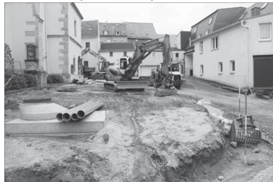
Bauarbeiten am Kirchplatz: beim Austausch des Baugrundes

Nach der längeren Winterpause haben die Arbeiten wieder begonnen. Leider gleich mit Entdeckungen, die wir eigentlich nicht machen wollten, aber üblich sind, wenn man tief in der Erde in einem schon lange angelegten Platz wühlt: Sie entdecken Leitungen und Rohre, die nicht so sind wie sie eigentlich sein sollten und die Leitungsaukünfte, die man natürlich vorher einholt, aussagen. Wir kämpfen derzeit mit den Anschlüssen an bestehende Regenwasserrohre, die möglicher Weise nicht so viel Wasser aufnehmen können wir gedacht und erforderlich. Das Wasser muss aber weg, soll es nicht in die Häuser fließen. Dies wird derzeit abgeklärt und ich hoffe sehr, dass wir nicht noch mehr aufreißen müssen, um das Kirchplatzwasser auch ordentlich zu entsorgen. Noch nicht gesichert ist die Größe der neu zu pflanzenden Bäume – bedingt durch die Fällung der letzten Linde (die tatsächlich ganz hohl und pilzbefallen war) ist das Budget sehr knapp geworden. Die Stadt konnte den Heimatsender MDR gewinnen, diesen in der Neupflanzung als Lutherbaum zu fördern, weshalb er recht stattlich daherkommen wird. Für die anderen haben wir die Kirche für ihren Platz um Hilfe gebeten, damit wir größere Bäume bestellen als dies mit den