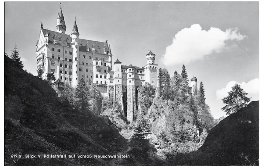
619a Blick v. Pöllathfall auf Schloß Neuschwanstein

Jahren des vorigen Jahrhunderts in der Zeit der Weltwirtschaftskrise nach einer Fotopostkarte und zwei farbigen Abbildungen auf dem Deckel einer Zigarrensachtel. Max Schmidt hatte in der Eisengießerei Mattick gearbeitet und war arbeitslos geworden. Als Material für „sein Schloss“ nutzte er ausschließlich Zigarrensachteln. Das Modell wurde in der Familie behütet, bespielt und weitervererbt und nun von der Enkelin des Schöpfers an das Stadtmuseum Pulsnitz geschenkt. Dort wird es künftig mit anderen Ausstellungsstücken von erfüllter und unerfüllter Reisesehnsucht der Pulsnitzer Bürger künden. S. Sch.