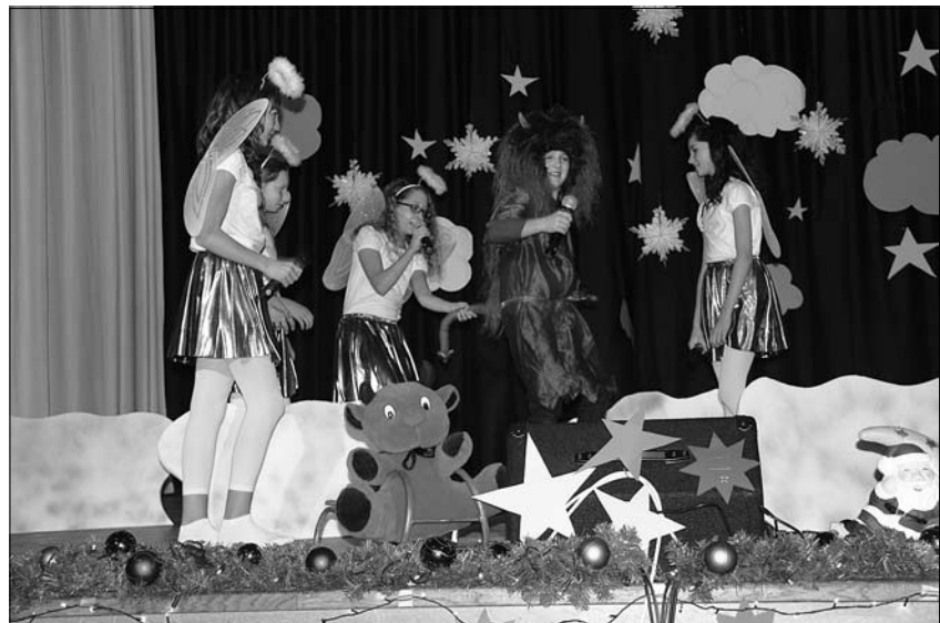
Weihnachtsprogramm der Pulsnitzer Oberschüler aus einem der letzten Jahre.