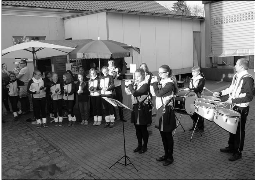
Auftritt beim Pfefferkuchenmarkt in der Lebkuchenfabrik

Wir hatten schöne Auftritte, tolles Publikum und auch auf das Neugelernte – unser „Pulsnitzer Schlagwerkes“ kommt gut an und wir geben bei jedem Auftritt das Beste. Wenn also bei Ihnen ein Kind ist, was gerne trom-