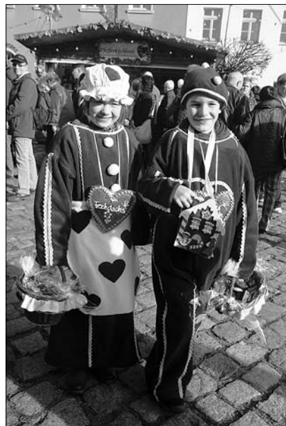
Die Pulsnitzer Pfefferkuchenkinder

Und besonders wichtig ist, wer seine Pfeffer-