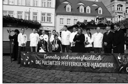
Eröffnung des Pfefferkuchenmarktes

Eng ging es wieder zu zum Pfefferkuchenmarkt. Zeitweise wurde man vom Menschenstrom regelrecht durch die Gassen getragen. Lange Schlangen bildeten sich nicht nur bei den Pfefferkuchlern. Auch das historische Handwerk um die Nikolaikirche war dicht belagert.