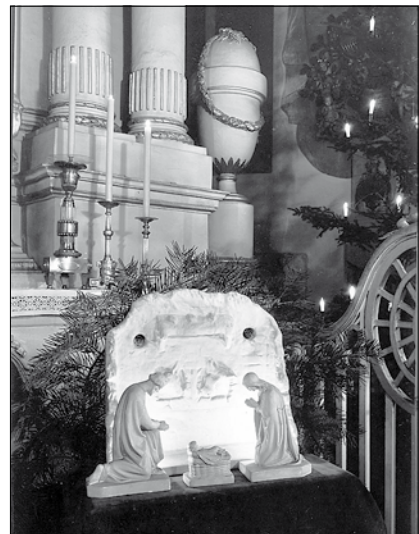
Weihnachtskrippe von Ernst Rietschel