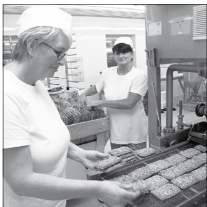
Pfefferkücherei E.C. Groschky Spezialitäten: Rietschelkuchen und Hanf- und Ingwerpfefferkuchen Abbildung: Mitarbeiterinnen überziehen Haselnusspfefferkuchen.