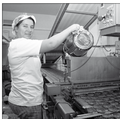
Pulsnitzer Lebkuchenfabrik GmbH Spezialitäten: Eierlikör- und Aroniaspitzen, Eri-Kuchen (nach dem Firmengründer Erich Richter) Abbildung: Mitarbeiterin glasiert Pfefferkuchen am Band.