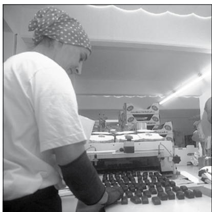
Georg Gräfe Pulsnitzer Pfefferkuchen GmbH & Co. KG Spezialitäten: Original Sauerkirchspitzen und Cranberrytaler Abbildung: Mitarbeiterin beim Eintüten von Spitzen.