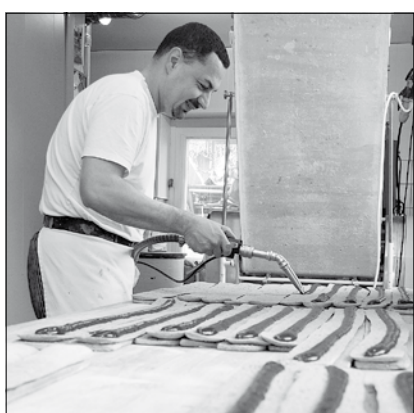
Pfefferkücherei Richard Nitzsche Spezialitäten: Pulsnitzer Pralinenkuchen mit Kirschwasser und das große Pfefferkuchenpaar Abbildung: Matthias Garten bringt Marmelade auf.