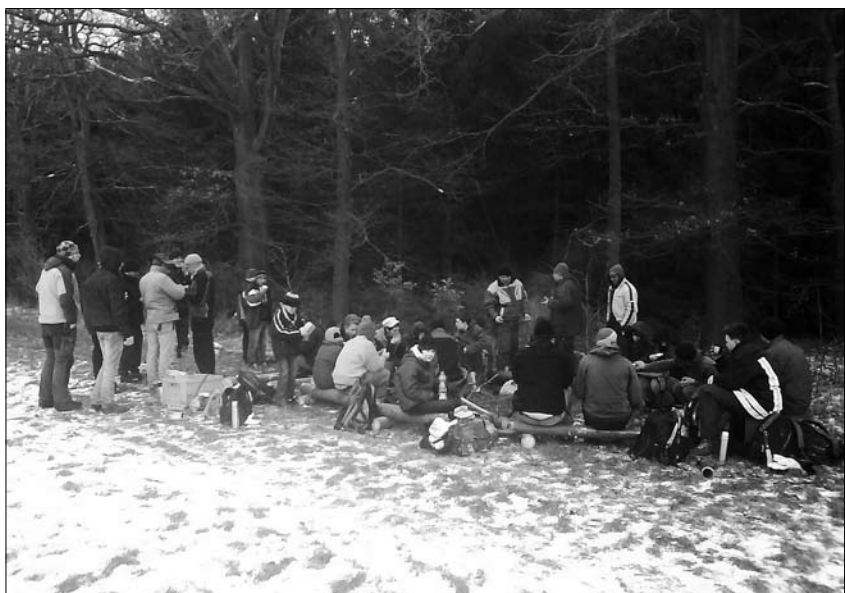
Picknick beim Holzfällereinsatz im Tharandter Wald

Zum vorbereitenden Stammtreff-Theme treffen wir uns wieder am 25. April von 14-18 Uhr hier in Pulsnitz, Hempelstraße „Wilde Freiheit“. Gespannt sind schon viele Kinder auf das neue Abenteuer. Wel-