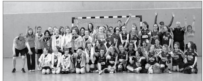
Die weiblichen Mannschaften beim Austausch 2014 in Pulsnitz.

In diesem Jahr feiert der deutsch-französische Jugendaustausch sein 10-jähriges Jubiläum. Die teilnehmenden jungen Handballerinnen und Handballer aus dem C- und D-Jugendbereich des HSV 1923 Pulsnitz e.V. und der SG Oberlichtenau und Ihre Trainer/Mannschaftsverantwortlichen freuen sich schon auf die im April stattfindende Reise zu Ihrem Partnerverein nach Le Relecq Kerhuon. Die Vorbereitungen für den diesjährigen Austausch laufen bei beiden Vereinen seit Monaten auf Hochtouren. Eine Premiere stellt in diesem Jahr die Beteiligung der Pulsnitzer Leichtathleten dar, auch die Großnaundorfer Fußballjugend nimmt, wie in den vergangenen Jahren, am Austausch teil. Begeisterung und viel persönlichem Engagement dabei. Aber auch „neue“ Gesichter bringen ihre Ideen ein. Diejenigen, die zum ersten Mal die lange Busfahrt in die Nähe von Brest auf sich nehmen, werden sicherlich schon durch die herzliche Begrüßung von den Strapazen der Anreise entschädigt. Einen besseren Gastgeber als den Partnerverein Pont de L'Iroise HB können sich die Pulsnitzer/Oberlichtenauner Handballer nicht wünschen. Auch dort ist jeder mit Herzblut dabei und kann den nächsten Austausch kaum erwarten. Das angenehme und freundliche Miteinander und das hohe persönliche Engagement sind die Grundlagen für die langjährige Verbundenheit der Vereine. Für die mitreisenden