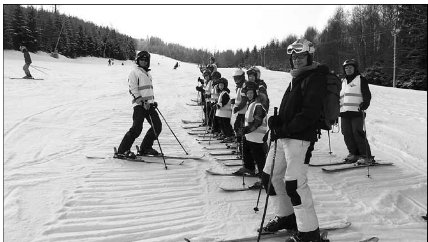
Winterlager in Harrachov: Skigruppe 2 bei der Ausbildung