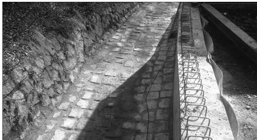
Die Bauarbeiten an der Bachsohle sind beendet und seit dem 13. März läuft das Wasser der Pulsnitz wieder im gewohnten Bett.

Seit Ende Februar sind die Bauarbeiten wieder in Gange. Gegenwärtig werden die Natursteinverlegeteile im Bereich der Bachsohle durchgeführt. Geplante Fertigstellung für diese Arbeiten war Mitte März. Damit ist die endgültige Bachsohle im Bereich der Mauersegmente 1-10 wieder hergestellt.