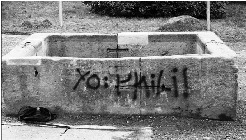
Historischer Sandsteinbrunnen auf dem Polzenberg mit Graffiti versehen