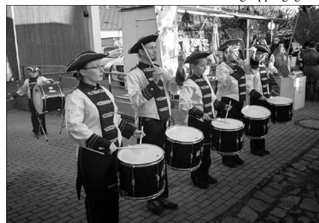
Auftritt der neuen Trommlergruppe

Liebe Musik- und Instrumentenfreunde, der Spielmannszug Pulsnitz e.V. ist mit tollen Ideen in das Jahr 2015 gestartet und die wollen wir Ihnen und Euch vorstellen.