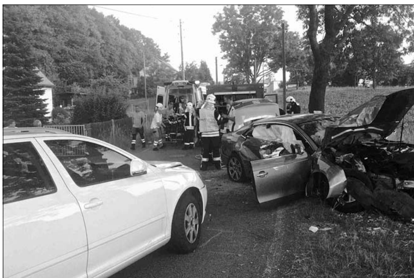
Zu einem schweren Verkehrsunfall mussten die Wehren von Oberlichtenau, Friedersdorf und Pulsnitz/Stadt zur Großnaundorfer Straße in Oberlichtenau am 9. Juli 2013 nach 19.00 Uhr ausrücken.

Auch in Pulsnitz ist die Jugendfeuerwehr ein wichtiger Faktor, um Probleme des Nachwuchses zu lösen. Durch die gute Arbeit der Jugendfeuerwehrwarte Antje Arndt und Norbert Zschaler war es möglich, zwei Jugendliche in die aktive Abteilung aufzunehmen. Diese werden nach erfolgreicher Teilnahme an der Grundausbildung und nach Erreichen des 18. Lebensjahres die Einsatzkräfte stärken.