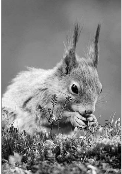
Eichhörnchen in der Finnischen Taiga

Am 24. April 2013 um 19 Uhr eröffnete Günter Fünfstück mit seinem Vortrag „Von Südtirol ins Aostatal“ im Kultursaal der HELIOS Klinik Schloss Pulsnitz erneut eine Ausstellung mit Naturfotografie.