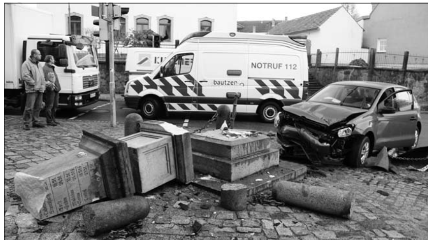
Ein Unfall, den viele Pulsnitzer sehr bedauerten: neben der Fahrerin, die leichte Verletzungen erlitt, entstand erheblicher Sachschaden am historischen Denkmal und am Fahrzeug.

Am 11. April gegen 10.30 Uhr erlitt eine 66-Jährige Fahrerin mit ihrem VW Polo auf dem Wetzinplatz in Richtung Kamenz fahrend einen Schwächeanfall. Sie kam mit ihrem Fahrzeug von der Fahrbahn ab und durchbrach zwei Absperrketten und prallte gegen das dahinter befindliche Podest der historischen Postmeilensäule. Die Fahrerin wurde dabei leicht verletzt und am Fahrzeug entstand erheblicher Sachschaden. Die erst 2005 aufwendig renovierte Säule zerbrach in sieben große Stücke und unzählige Sandsteinsplitter. Die Polizei bezifferte den Gesamtschaden auf 20.000 Euro.