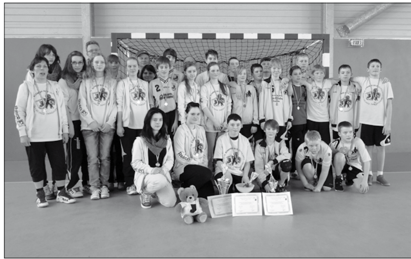
Die Pulsnitzer Teilnehmer des diesjährigen Frankreich-Austausches

Aber das Spannendste am Turnier waren die Spiele der gemischten Mannschaften, an denen sowohl die Jugendlichen als auch die Betreuer teilnahmen. Die Teams waren außerdem französisch-deutsch und männlich-weiblich gemischt. Diese Spiele waren wohl auch die lustigsten des Tages, da es hier nicht um Sieg und Niederlage, sondern um den Spaß am Spiel und das Miteinander ging. Aufgrund der großen Anzahl derer, die hier mitspielen wollten, konnte ständig gewechselt werden. Das Zusammenspiel funktionierte hervorragend, auch wenn man