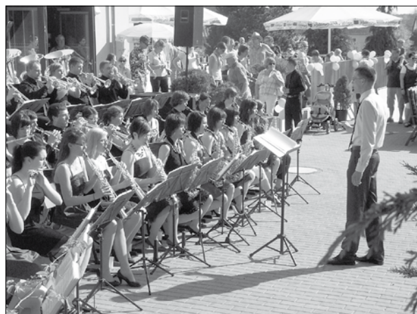
Alle Musikformationen des Spielmannszuges Oberlichtenau präsentieren sich am 1. Mai.

Während sich die Erwachsenen bei Kaffee und Kuchen an der Musik und Unterhaltung erfreuen, sollen natürlich die Kleinsten nicht zu kurz kommen. Unterstützt durch die Grundschule „Am Keulenberg“, die Kindertagesstätte Oberlichtenau sowie engagierte Eltern wird es ein vielfältiges Angebot sowohl in der Grundschule als auch auf dem Festgelände geben, wie beispielsweise eine Ausstellung der künstlerischen Werke der Grundschüler, Kinderschminken und vieles andere mehr. Für die Kinder, die Interesse an Musik haben, gibt es wieder die Möglichkeit, die verschiedenen Instrumente des SZO einmal selbst zu probieren. Dazu werden die Ausbilder des Vereins für eine Schnupperprobe und für Fragen zur Verfügung stehen. Sowohl die Vereinsräume in der Schule als auch die Räumlichkeiten des Sport- und Freizeitzentrums und der Grundschule stehen zur Besichtigung offen. Der Eintritt für dieses Fest am 1. Mai ab 14:30 Uhr in Oberlichtenau ist natürlich frei.