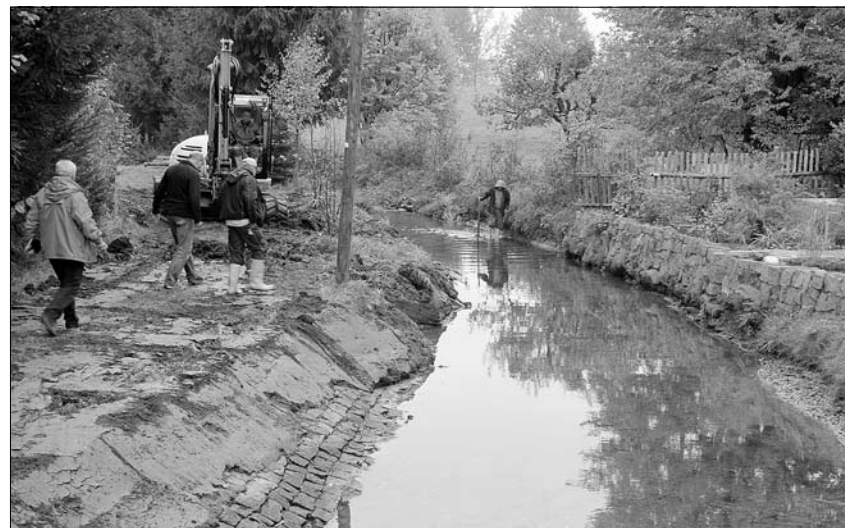
Das Flussbett der Pulsnitz wird derzeit in Friedersdorf beräumt.

Sämtliche ausgeschriebenen Straßenbaumaßnahmen wurden bereits bis Ende September erledigt. Folgende Arbeiten wurden zur vollsten Zufriedenheit der Verwaltung ausgeführt: 1. Einbau einer neuen Tränkmakadamdecke (Verschleißschicht) in einem ersten Bauabschnitt Friedersdorf Siedlung, eine weitere Tränkmakadamdecke wurde im Bereich der unteren Poststraße/Rietschelstraße eingebaut. 2. Asphaltarbeiten wurden auf der Vollungstraße (nur zwei kleine Bereiche) und der Bachstraße (Brückenbereich vor ehemals Färberei Hauptmann) durchgeführt, damit