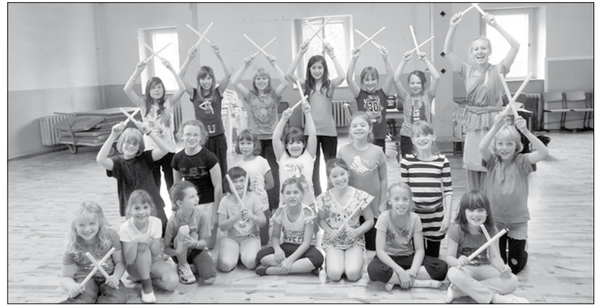
Pulsnitzer Kinder trainieren regelmäßig Tanzen in der Kante.

Die Zusammenarbeit mit internationalen Gastdozenten wird die TTW weiterhin auch im Raum Kamenz ausbauen, um den Kindern und Jugendlichen noch mehr Einblick und Aufklärung zu geben, wie wichtig und vor allem spannend das Erleben anderer Kulturen und Traditionen ist.