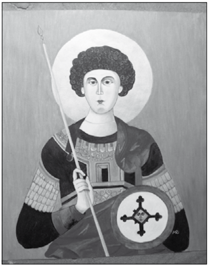
Ikone des Hl. Georg, diese ist Bestandteil der Ikonostase im Museum.

Ein erster Teil dieses Museums war bereits im September 2010 eröffnet worden, nun wurde es erweitert und vervollständigt. Es ist wohl das einzige Museum dieser Art in Mitteldeutschland. Gezeigt werden ungefähr 50 Ikonen, alle gemalt von Ikonenmaler Manfred Richter aus Ossling. Der Maler entdeckte die Ikonenmalerei während eines Zypernurlaubs und machte sie zu seinem Hobby. Alle Bilder entstanden während der letzten 15 Jahre. Es sind ausnahmslos Originale, welche dem Museum als Dauerleihgabe zur Verfügung gestellt werden. Das Herzstück der Ausstellung bilden eine extra für das Museum gemalte Ikonostase und ein „echter“ Heiliger Nikolaus.