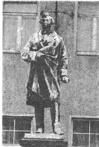
Das ehrwürdige Denkmal auf dem Markt

Vor 100 Jahren wurde das Ernst-Rietschel-Denkmal auf dem Pulsnitzer Marktplatz enthüllt. Sein Schöpfer Gustav Kietz hat es im Auftrag des Landes-Kunstfonds in Gemeinschaft mit der Stadt Pulsnitz geschaffen. Es zeigt Ernst Rietschel mit offenem Mantel in aufrechter Haltung und mit dem typischen Handwerkszeug, Schlegel und Meißel der Bildhauer. Ernst Rietschel war ein bedeutender Bildhauer seiner Zeit. Er hat u. a. das berühmte Goethe-Schiller-Denkmal in Weimar geschaffen. Aber auch die Martin-Luther-Denkmal in Worms und vor der Frauenkirche in Dresden und das Carl-Maria-von-Weber-Denkmal vor dem Dresdner Schloß. Auch der goldene Löwe an der Pulsnitzer Löwenapotheke soll von ihm stammen.