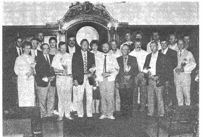
Unsere gewählten Abgeordneten nach ihrer ersten Sitzung auf einen Blick.

Alle Stadtverordneten sind für die Probleme ihrer Ausschüsse jederzeit von den Bürgern ansprechbar und verantwortlich.