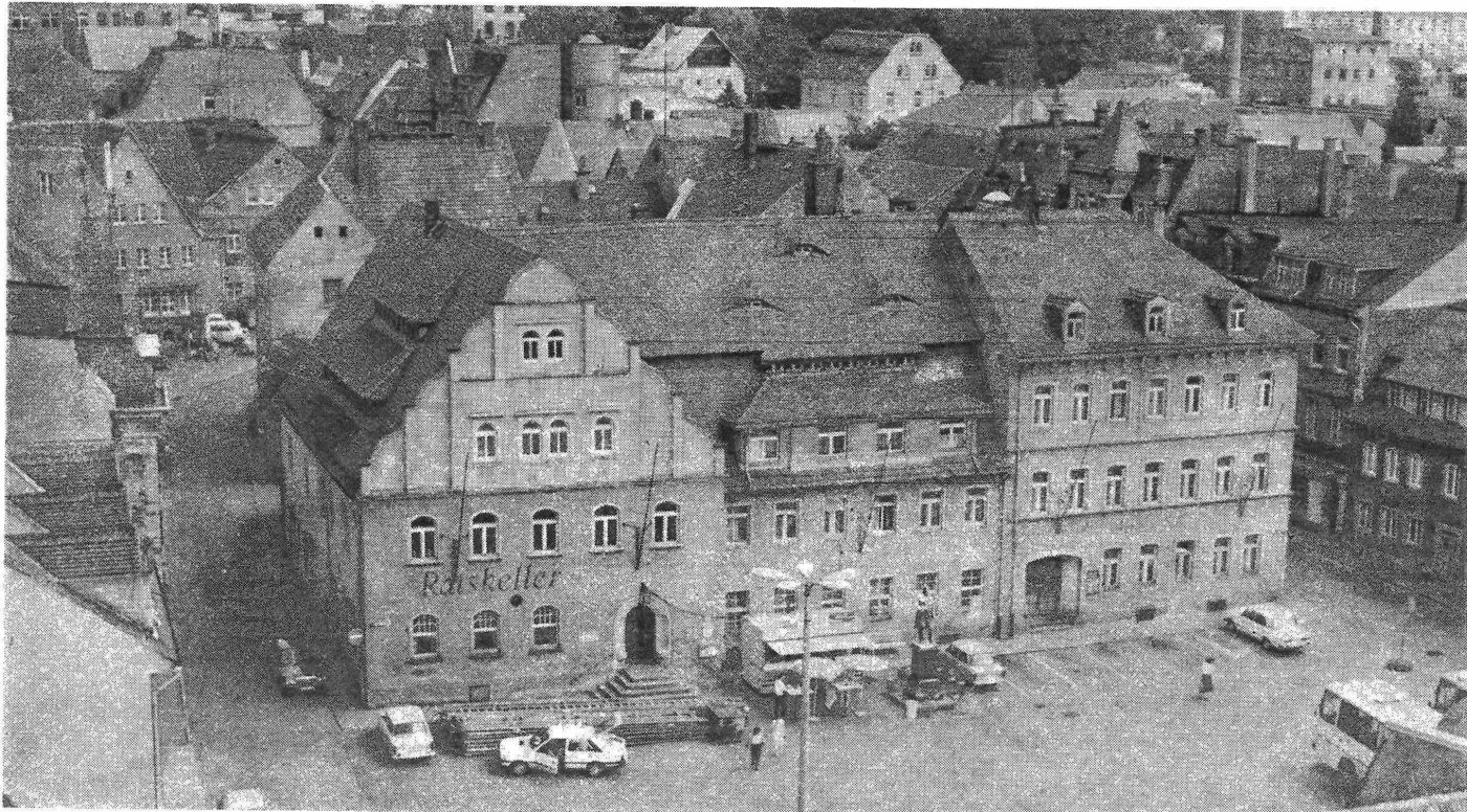
Die bekannteste Ansicht des Marktes mit aktueller Details